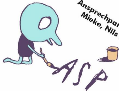
Illustrationen: Gabi Garland

Ansprechpartner/Innen: Mieke, Nils und Kai