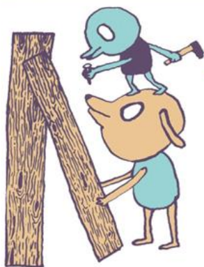
Illustrationen: Gabi Garland

Fr 01.07. ab 15:00 - So 03.07. 13:00 ZELTEN IN DER GROSSSTADT Der Griff nach den Sternen Sterne beobachten, Kino, für Kinder ab 8 J.