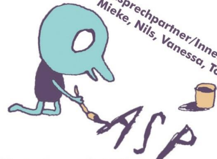
Illustrationen: Gabi Garland

*CLUBMITGLIEDER AUF DEM ASP SIND ALLE SCHULKINDER IM ALTER VON 6 - 14 JAHRE OHNE BEGLEITUNG ERWACHSENER